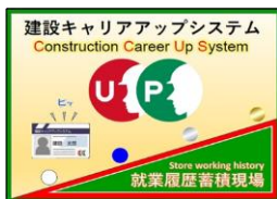
髙原 務仁 様