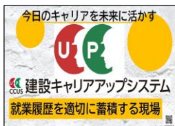
廣川 雅弘 様