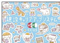
重本 結愛 様