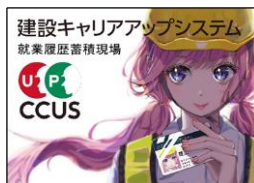
福嶋 里紗 様